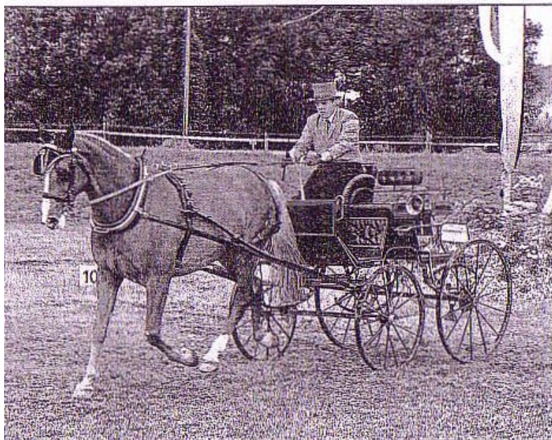
Schön anzuschauende Einspanner stellten ihre Geschicklichkeit auf einem Parcours unter Beweis.

an den Zügeln geführt werden – trägt beispielsweise einen Wasserkübel oder reitet durch eine flatternde Fahne. Die Rheintaler Pferdesporttage erwiesen sich als ein gelungener Anlass, sowohl als sportliches als auch als gemeinschaftliches Ereignis vieler Pferdesportfreunde